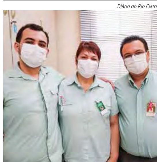
Diário do Rio Claro

Professores, alunos e educadores de toda rede de ensino de Rio Claro estão convidados para participarem do projeto 'Conhecendo os ODS' (Objetivos de Desenvolvimento Sustentável), que terá ações realizadas em uma plataforma digital e o material disponibilizado poderá ser utilizado pelos professores. Página 3